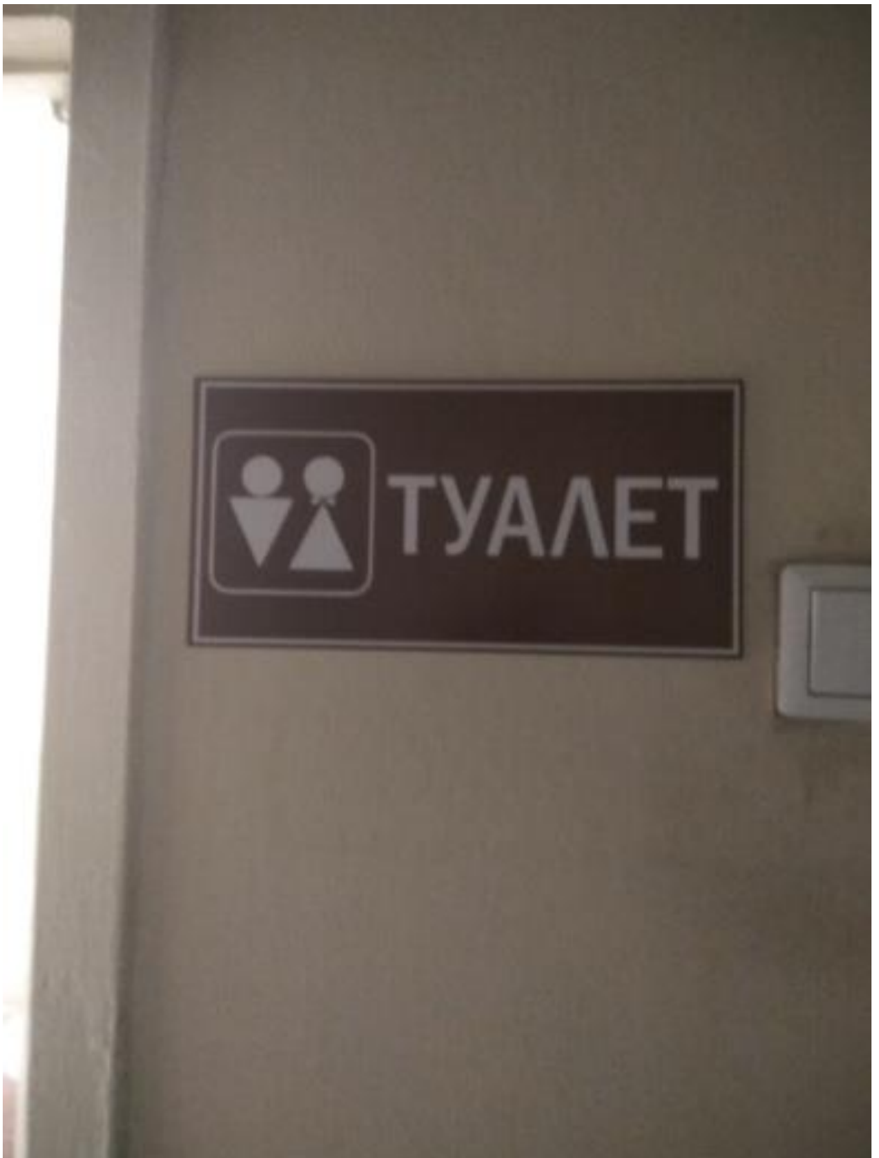
Фото № 10