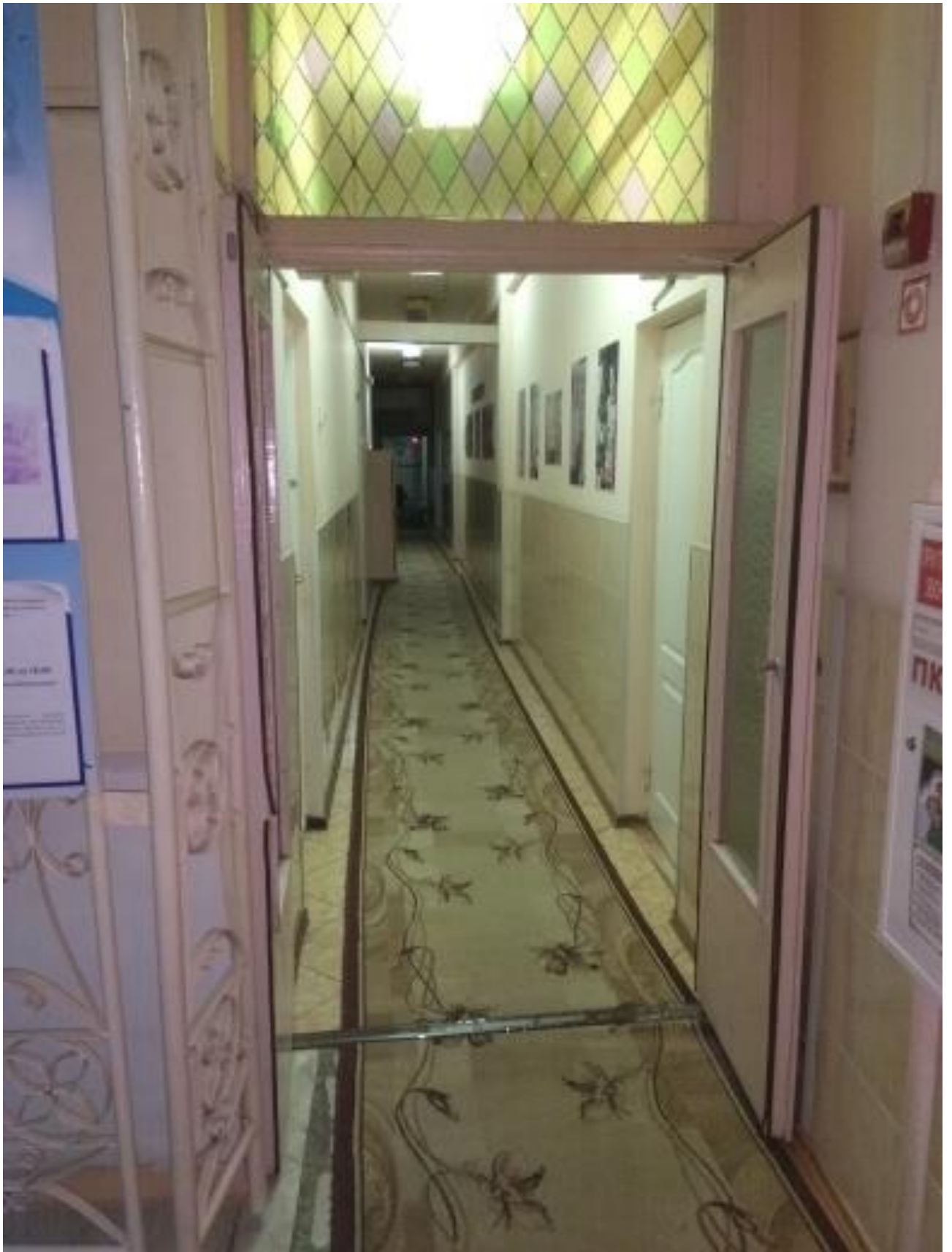
Фото № 6