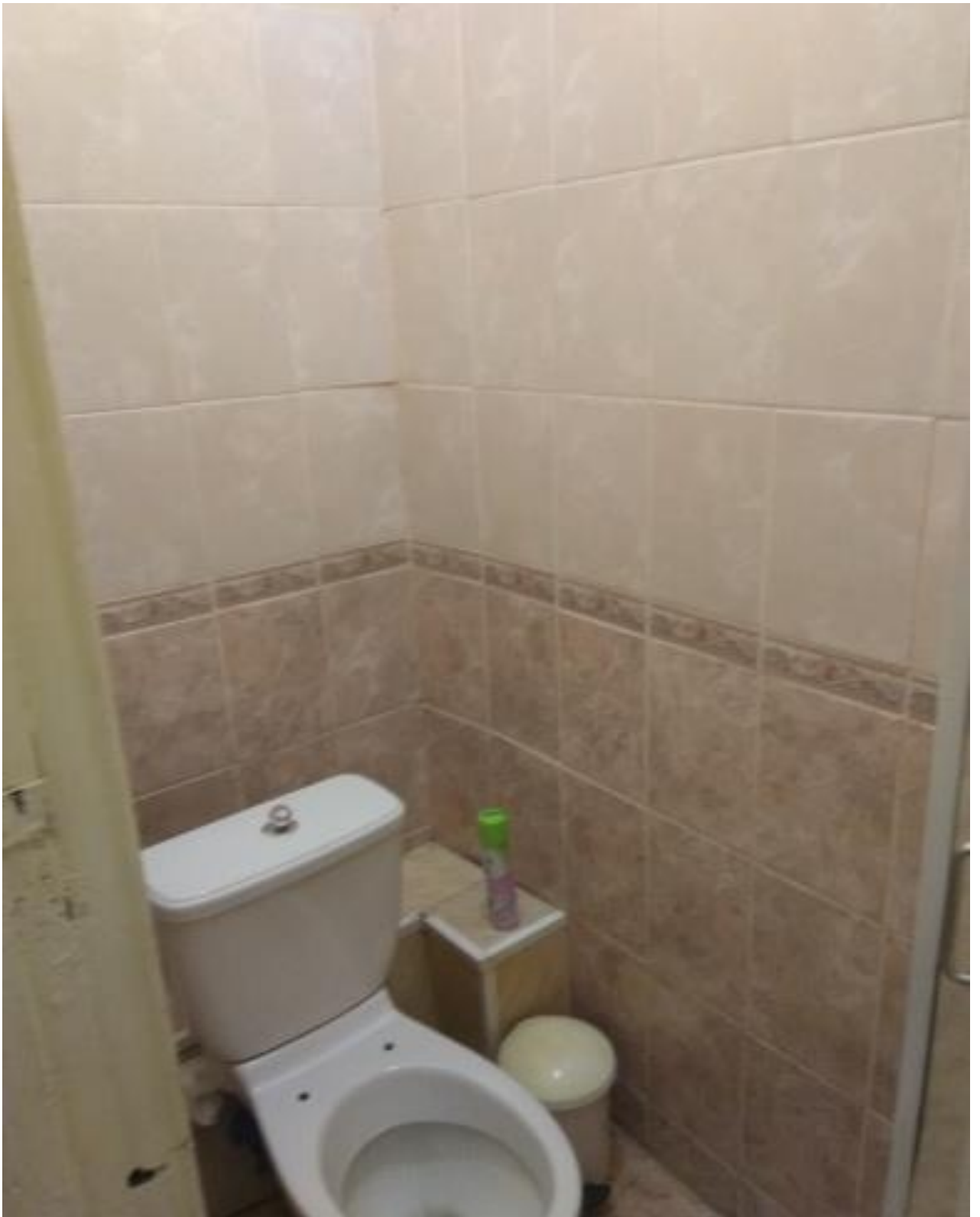
Фото № 11